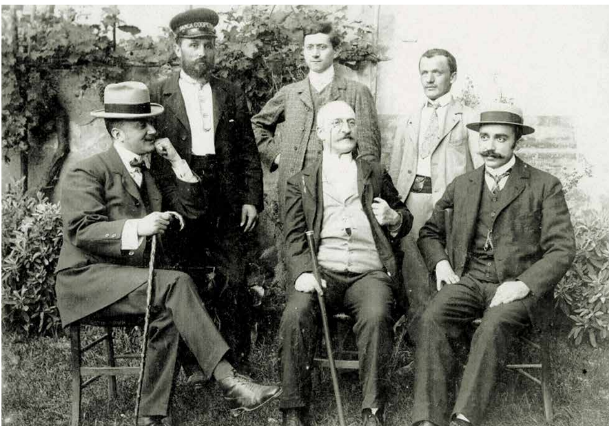
I primi dipendenti della Banca Cooperativa di Cividale