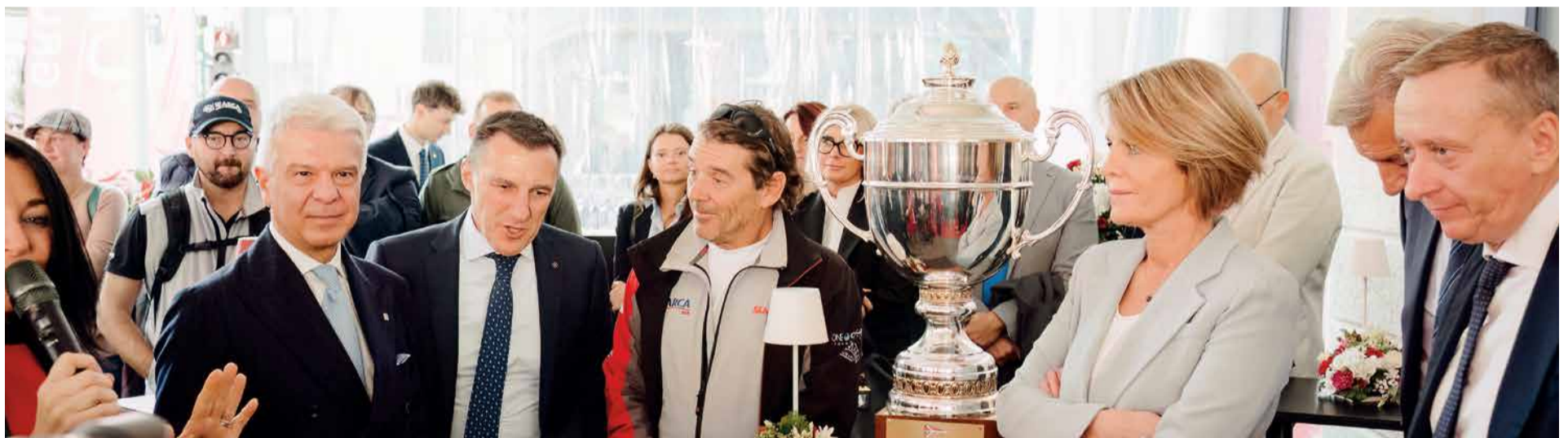
Il velista Furio Benussi ospite della filiale CiviBank di Trieste - Piazza Unità d’Italia