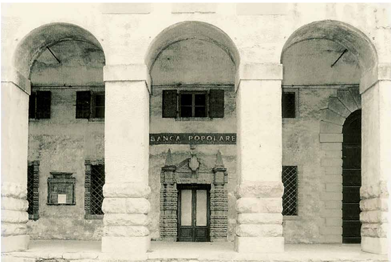
La prima sede della Banca Cooperativa di Cividale

Oggi CiviBank S.p.A. Società Benefit, certificata B Corp, appartenente al Gruppo Cassa di Risparmio di Bolzano, è presente in Friuli Venezia Giulia e in Veneto con 64 sportelli. Sviluppandosi costantemente e in maniera sostenibile nel tempo, CiviBank è riuscita a rispondere puntualmente ai nuovi obiettivi, mantenendo una dimensione locale. Da sempre promuove e sostiene la crescita economica, culturale, sociale della comunità di riferimento.