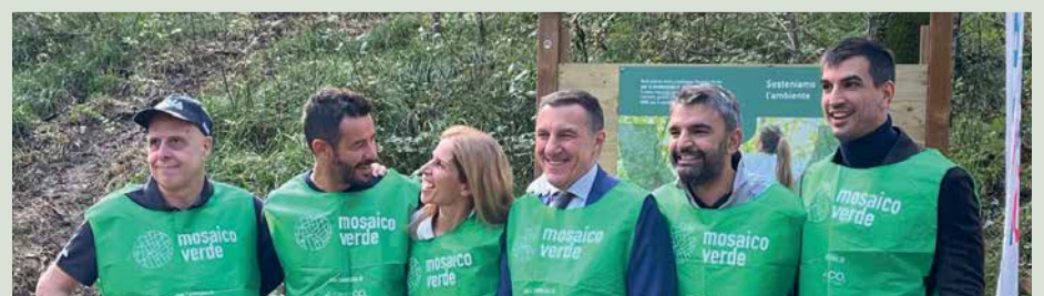
Trieste, Parco Farneto

finalità di beneficio comune e di sviluppo sostenibile operando in modo responsabile nei confronti della comunità e dell’ambiente. L’intervento di piantumazione a Trieste, realizzato con partner d’eccellenza, è un passo significativo per rafforzare ulteriormente il senso di responsabilità e appartenenza nei confronti del territorio. Questa lodevole iniziativa è un esempio di come la collaborazione tra tutti gli attori locali, possa generare un impatto positivo e sia la chiave verso miglioramenti considerevoli e sostenibili. CiviBank continua il suo percorso di banca locale e punto di riferimento virtuoso per il territorio, nella piena consapevolezza dell’importante ruolo che il nostro istituto svolge per lo sviluppo dell’economia locale e la crescita della comunità di riferimento”.