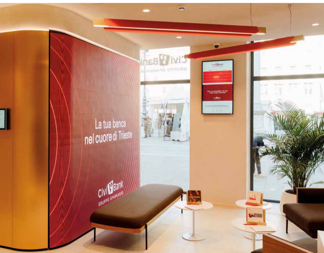
Filiale CiviBank di Trieste - Piazza Unità d'Italia